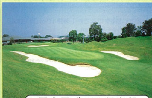
国木原ゴルフ倶楽部